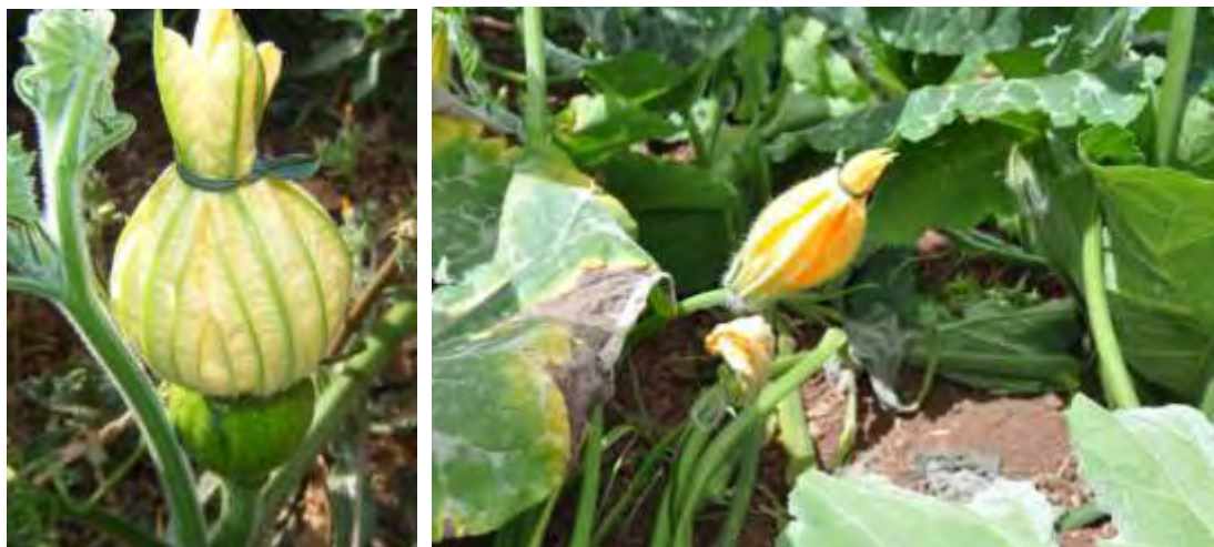
De izqda. a drcha: flor femenina y masculina cerradas para evitar la contaminación de polen.

Una vez seleccionadas, se cierran los pétalos cuidadosamente evitando la ruptura de la corola. De esta forma se asegura que, al abrirse la flor, los insectos polinizadores no se anticipen a la polinización.