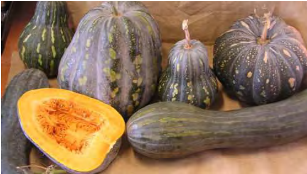
Variedades locales de calabazas

En Canarias existe una gran diversidad de variedades locales de calabazas ( Cucurbita moschata ) y bubangos ( Cucurbita pepo ). Estas cucurbitáceas forman parte de la cocina canaria en platos tan característicos como potajes, pucheros, etc. siendo muy apreciadas por su sabor, color y por formar parte de los cultivos tradicionales de las islas.