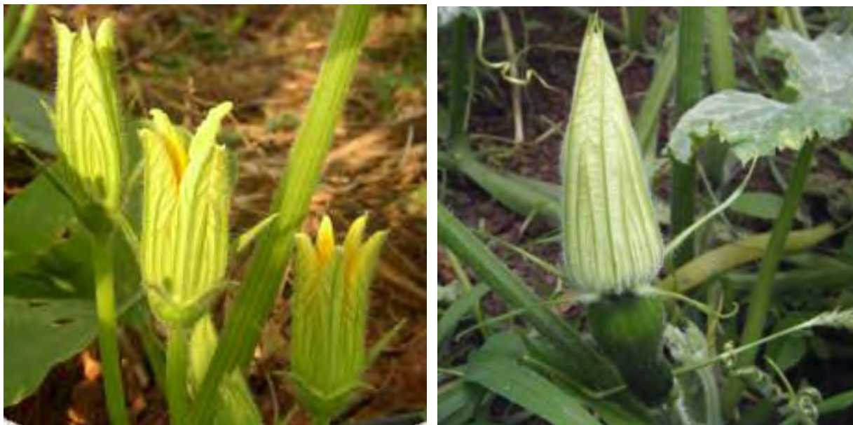
De izqda. a drcha: flor masculina y femenina el día anterior a la apertura.

En primer lugar se inspecciona el cultivo buscando la flores que van a abrir al día siguiente. Se reconocen por el tono amarillo pálido de la corola de las flores, las cuales se encuentran cerradas o comenzando a resquebrajarse y en posición erguida.